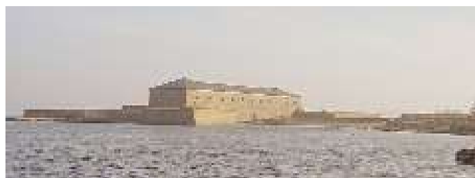
Drottningsskärs kastell i Karlskrona