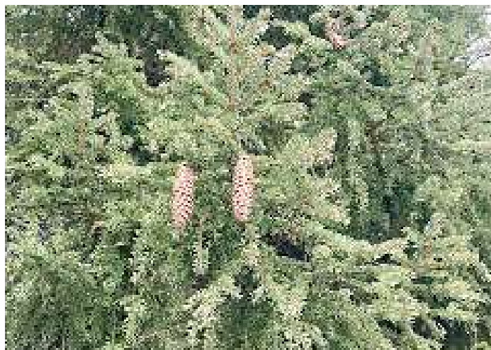
Kristina och hennes medhjälpare lydte rådet att bädda en säng med granris. Med tveksamt resultat...