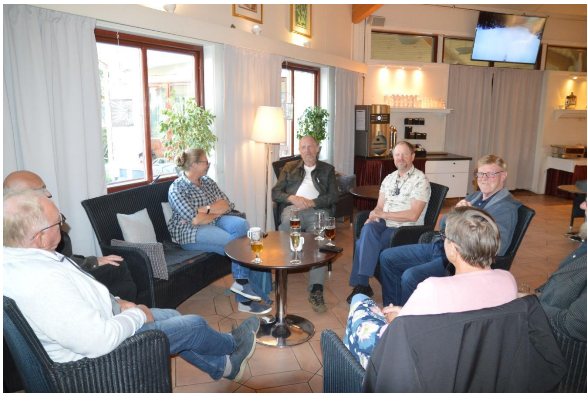
Presentation av varandra

Gruppledare och SRF:s styrelse samlades på fredagskvällen för gemensam middag. Det var första gången på nästan 2 år som vi kunde mötas fysiskt. Kvällen inleddes med att alla fick presentera sig och berätta om sin bakgrund. Därefter blev det en gemensam middag med social samvaro innan kvällen avslutades.