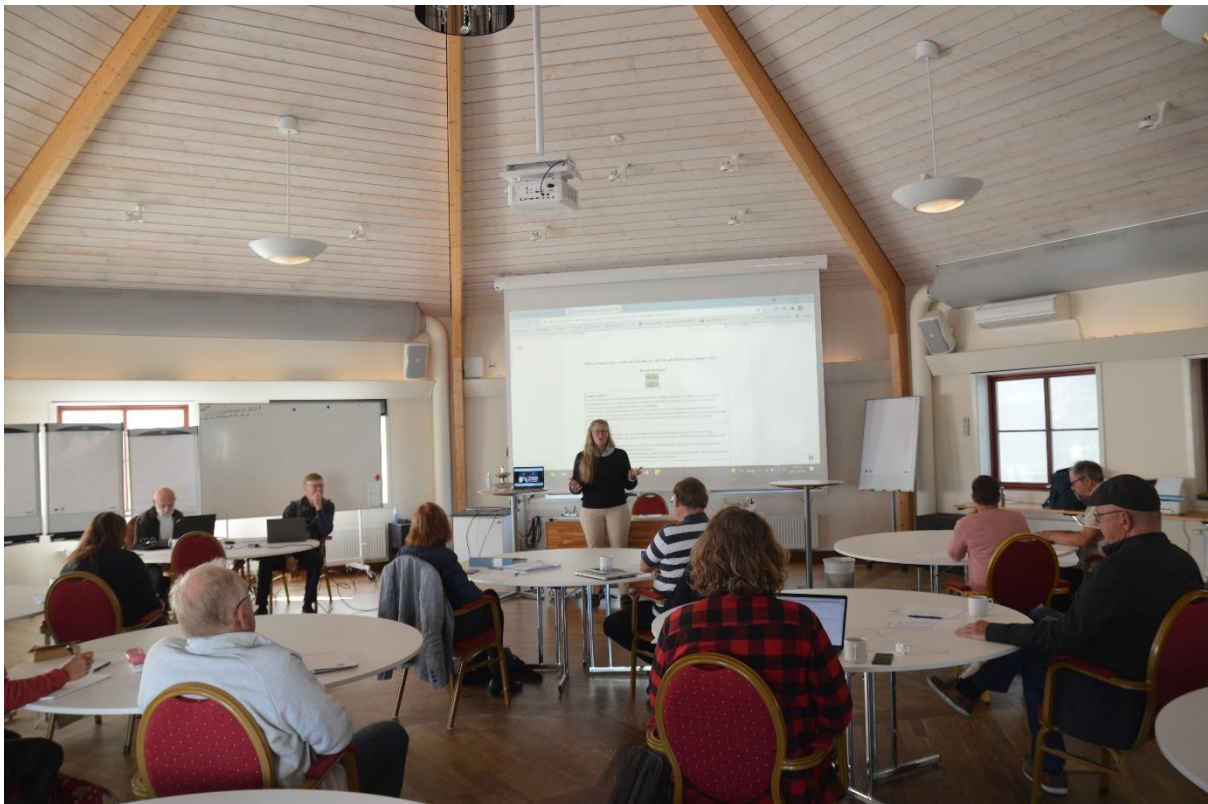
Samlade med Coronaavstånd

nätverk” men avveckla bloggen med samma namn. Marknadsföra gruppens produkter. Planera träff i Grisslehamn. Starta elevaktivitet med nytt tema. Uppmärksamma att nätverket är 10 år.